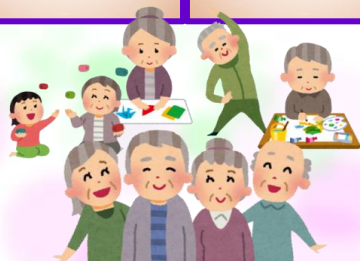
ここの体操で体を動かします

80㎡超のスペースのある「ここのひろば」を用意しています。地域の様々な世代の方々が活用でき、交流できるスペースを目指します。