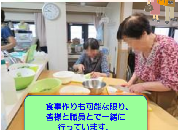
食事作りも可能な限り、皆様と職員とで一緒に行っています。