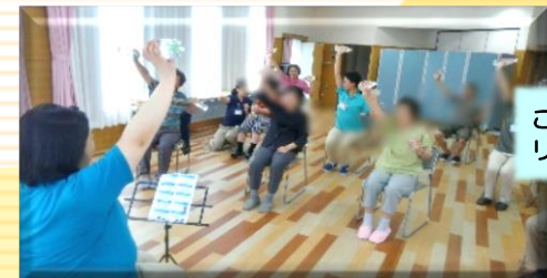
こころ体操でリフレッシュ